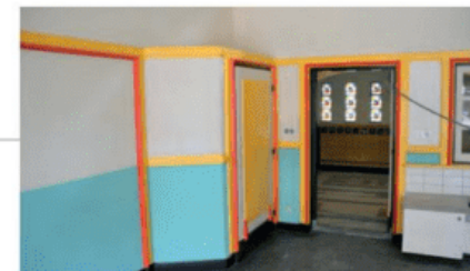
▲ De kinderen krijgen - door de expressieve kleuren - nu les in een bijzondere leeromgeving.

De Amsterdamse School (1910-1930) is een expressieve stroming in de Nederlandse architectuur, ontstaan in Amsterdam. De stroming is wat rijkdom aan vormen betreft uniek in Nederland en betrof niet alleen architectuur, maar ook ontwerpen voor meubelen en andere interieuronderdelen zoals lampen, klokken en textiel. De expressieve vormen en kleuren waren uniek in Nederland en ook internationaal van invloed. Het kleurgebruik van Amsterdamse School-architecten kan, volgens ken-ners, niet los worden gezien van hun individuele expressie als kunstenaar. Over het algemeen werd kleur gebruikt om een extra dimensie aan een ontwerp mee te geven.